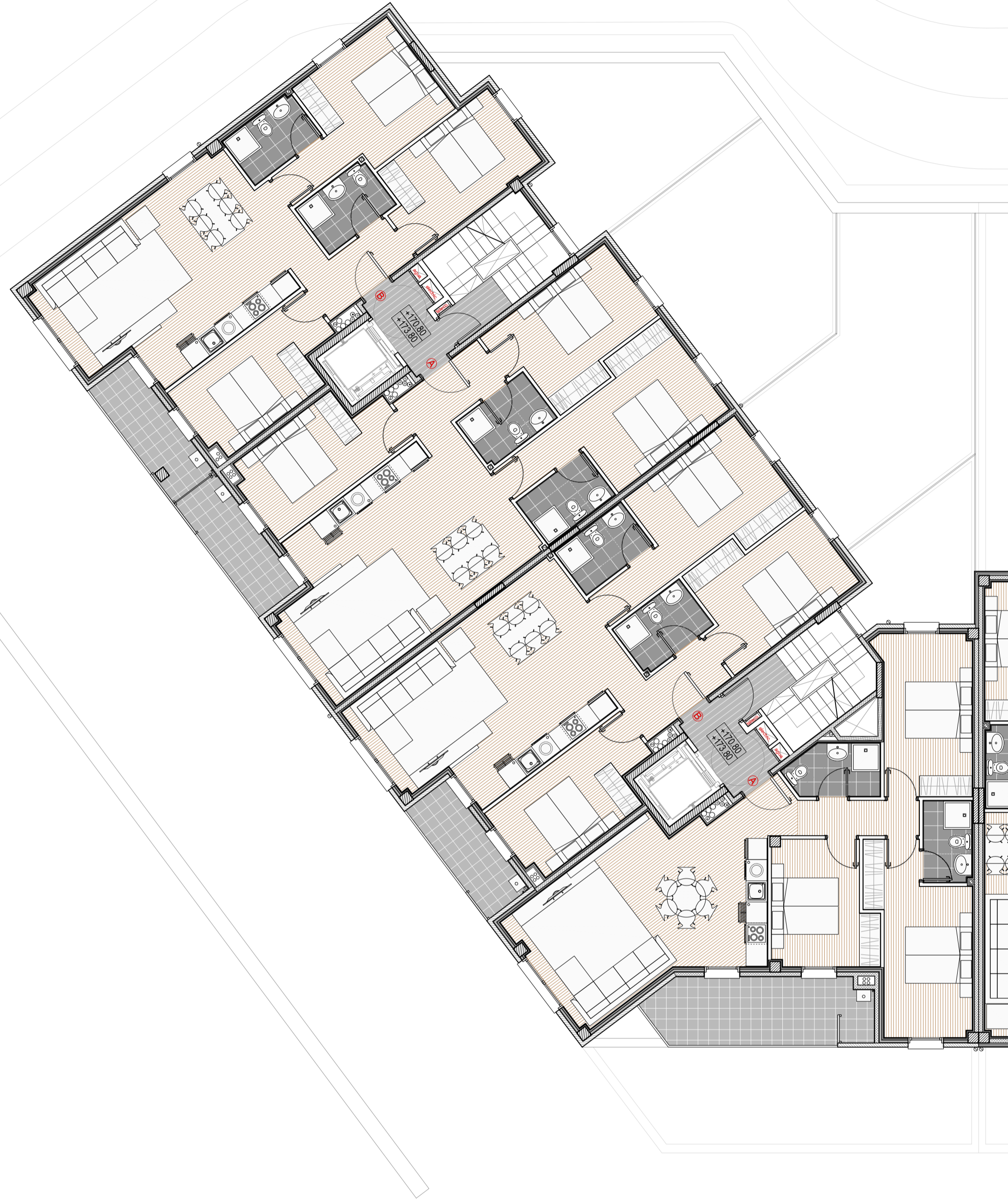
PLANTA TIPO (2ª y 3ª)